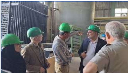
بازدید معاون بهداشتی دانشگاه و هیئت همراه از شرکت کربنات سدیم سرخه ۱۴۰۳/۰۷/۰۸