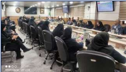
پنجمین نشست شورای پیام گزاران سلامت و دومین نشست خانه مشارکت مردم در سلامت زیرگروه دبیرخانه سلامت و امنیت غذایی استان سمنان ۱۴۰۳/۰۷/۰۹