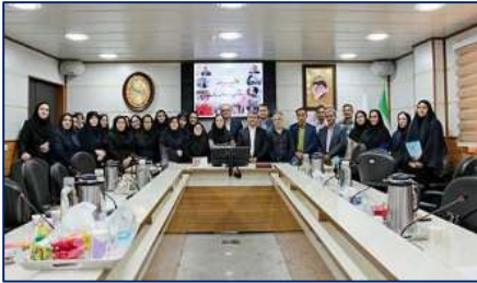
آئین تجلیل از فعالان عرصه بهداشت و بهورزی به مناسبت روز بهورز در دانشگاه برگزار شد ۱۴۰۳/۰۷/۰۸